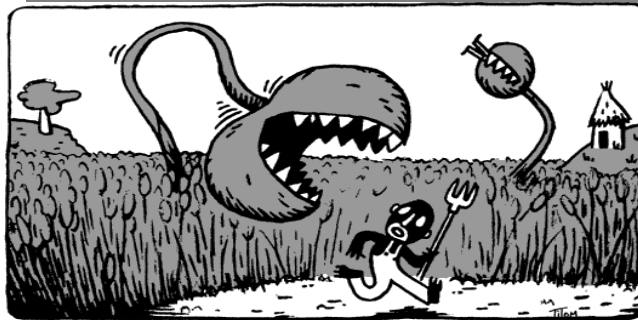
Les OGM suppriment les affamés, pas la famine!

Qui plus est, la sélection variétale consiste à accompagner, à orienter a posteriori la nature, alors que la transgénèse la modifie a priori . Le scientifique est en lutte contre la nature et veut l'asservir alors que le paysan fait avec .